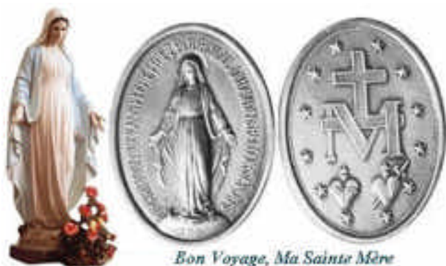
Bon Voyage, Ma Sainte Mère

PL : Mon Dieu, pour notre Padre : Protèges-le